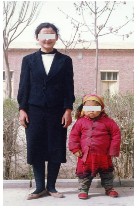
图2 同龄的正常人与地方性克汀病病人

碘缺乏严重损害胎儿脑和神经系统发育。妊娠妇女碘缺乏可以导致其患儿大脑发育落后、智力低下、反应迟钝；严重者导致克汀病，表现为呆、小、聋、哑、瘫等症状。此外，妊娠期缺碘导致的甲状腺激素合成不足还可引起妊娠妇女早产、流产及死胎发生率增加，也可引起妊娠妇女高血压、胎盘早剥等严重妊娠期并发症的发生率相应增加。